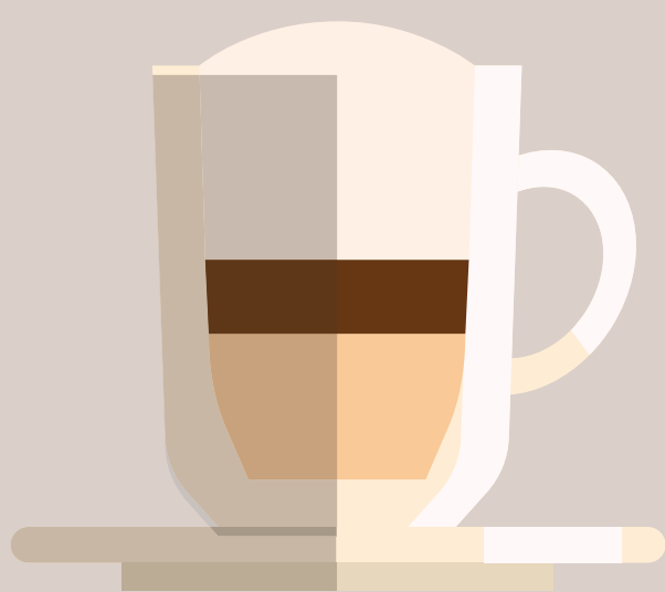
Caffé Latté Macchiato

25-30 ml vody / 7 g kávy Mléko dolit espressem